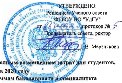
Таблица № 7